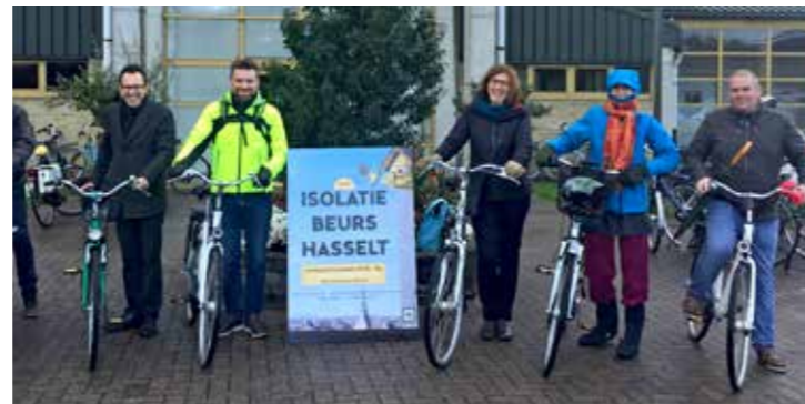
De eerste deelnemers aan de cluster van Hasselt bezochten enkele gevelisolatiewerken samen met de architecten van Dubolimburg

inspanningen van Dubolimburg en de stad Hasselt. Sinds medio 2017 worden 57 eigenaars uit Hasselt begeleid bij deze energetische verbeteringen aan hun woning.